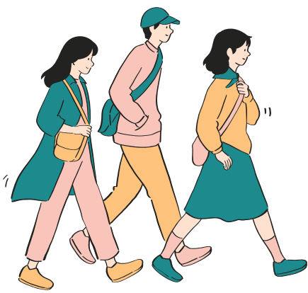
mers pe jos la școală în ritm rapid

Activitate fizică moderată: îți bate inima mai repede dar poți vorbi sau cânta.