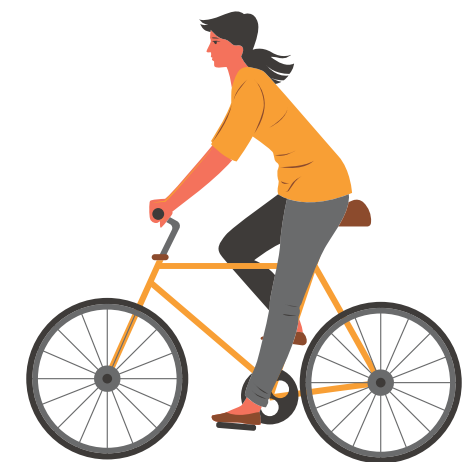
mers cu bicicleta