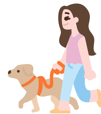
plimbat câinele în ritm rapid

Activitate fizică intensă: crește frecvența respirațiilor, vorbești greu în timpul ei.